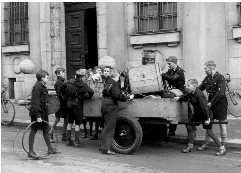
Bild 133-085 1933/1939 ca.

Elektronische Geräte können in jedem Radio- und TV-Fachgeschäft gratis zur Entsorgung abgegeben werden. Kühlschränke, Kochherde etc. sind direkt bei der Firma Halter Rohstoffe AG in Biel zu entsorgen.